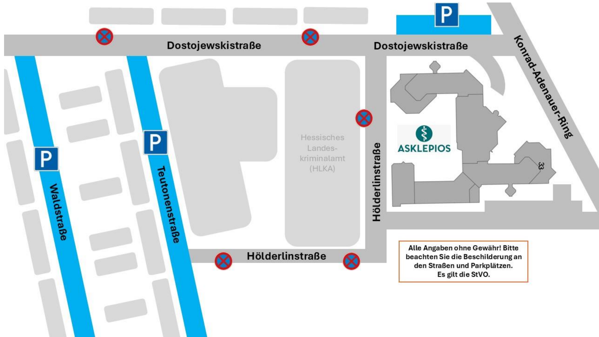
Übersicht 2: Kostenfreie Parkplätze für Besucher